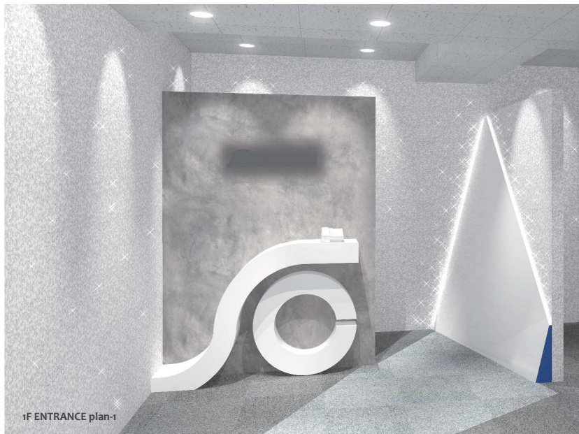
1F ENTRANCE plan-1