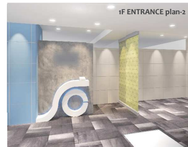
1F ENTRANCE plan-2