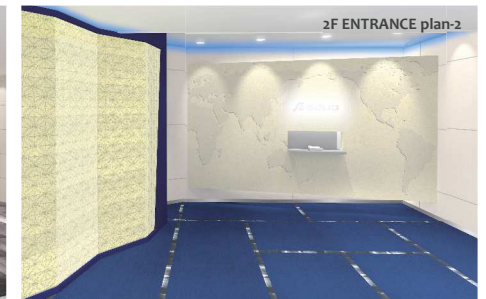
2F ENTRANCE plan-2