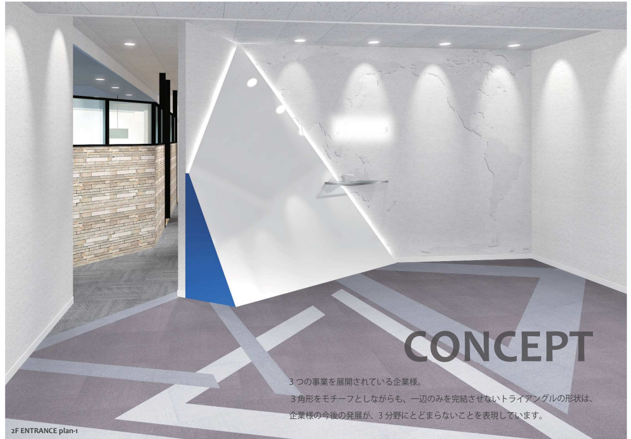
2F ENTRANCE plan-1

3つの事業を展開されている企業様。 3角形をモチーフとしながらも、一辺のみを完結させないトライアングルの形状は、 企業様の今後の発展が、3分野にとどまらないことを表現しています。